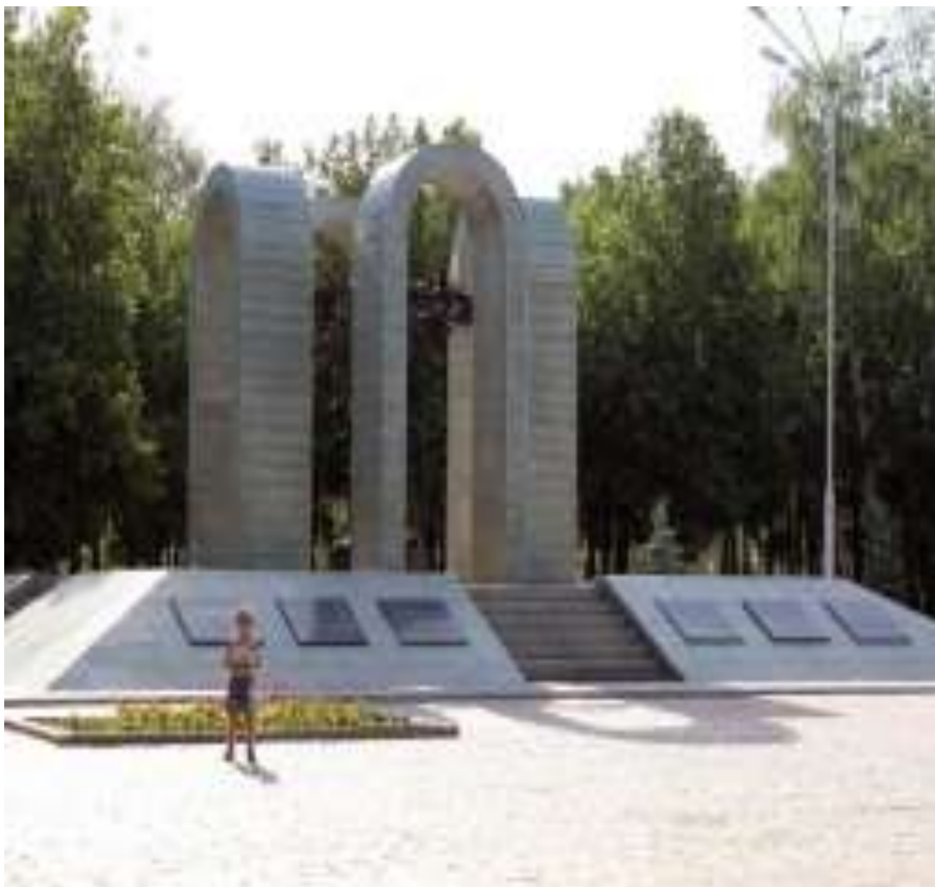
Памятник воинам - интернационалистам г. Стерлитамак