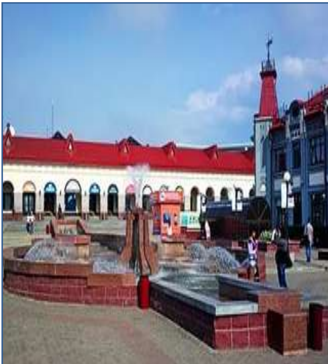
Гостинный двор г.Уфа