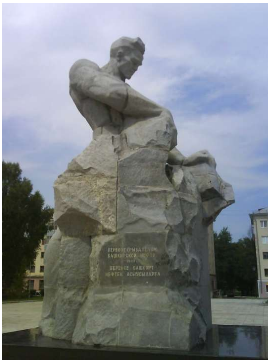
Памятник первооткрывателям башкирской нефти г. Ишимбай