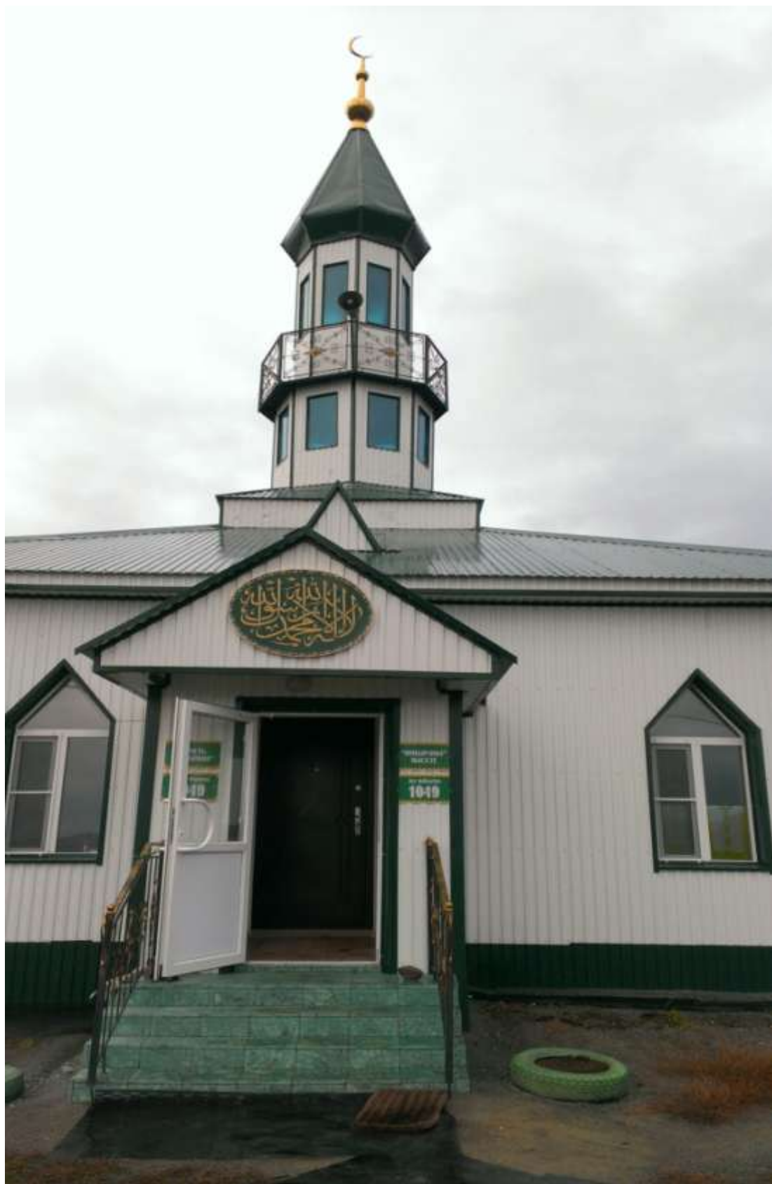
Мечеть в селе Учалы