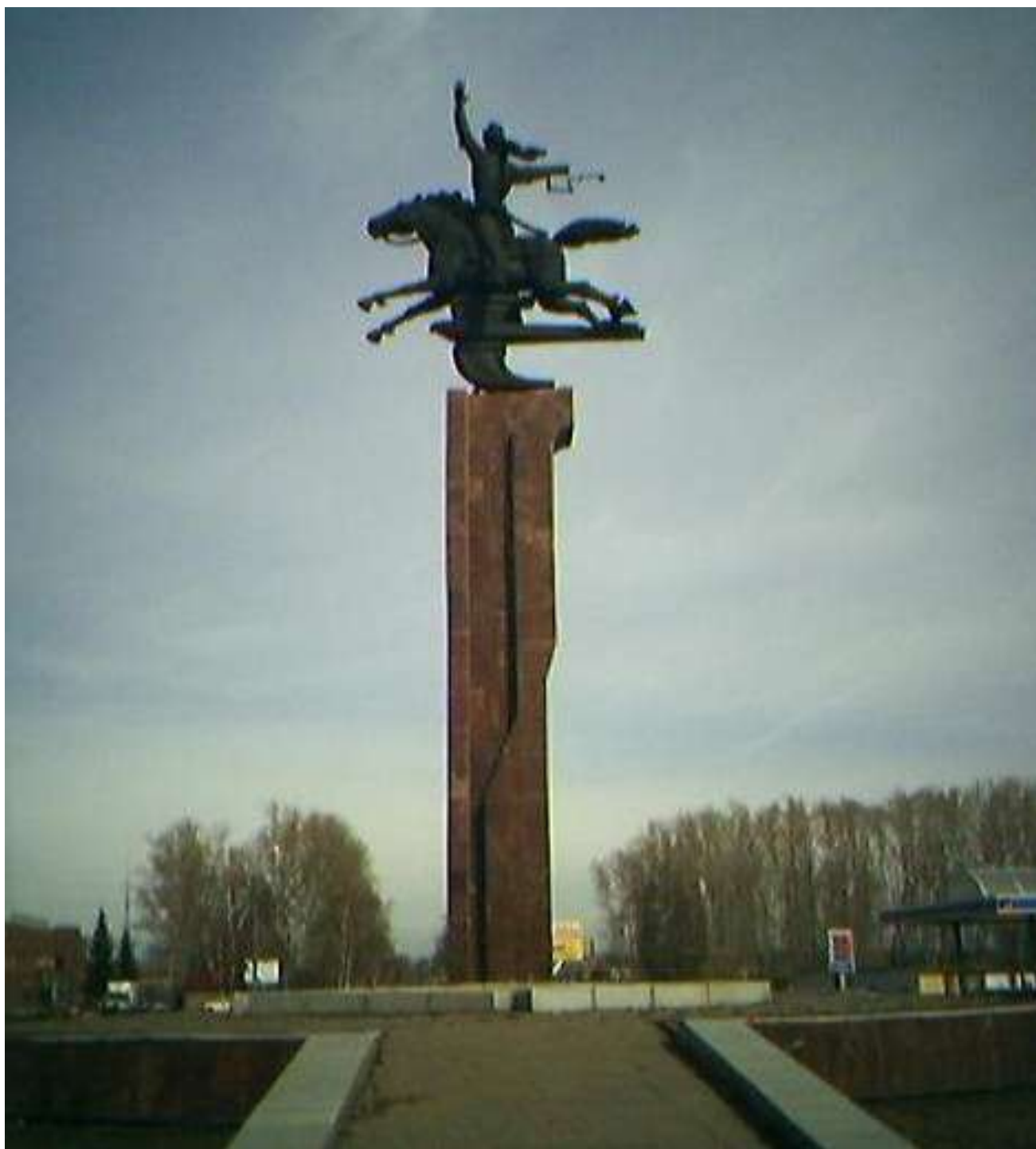
Памятник Салавату Юлаеву