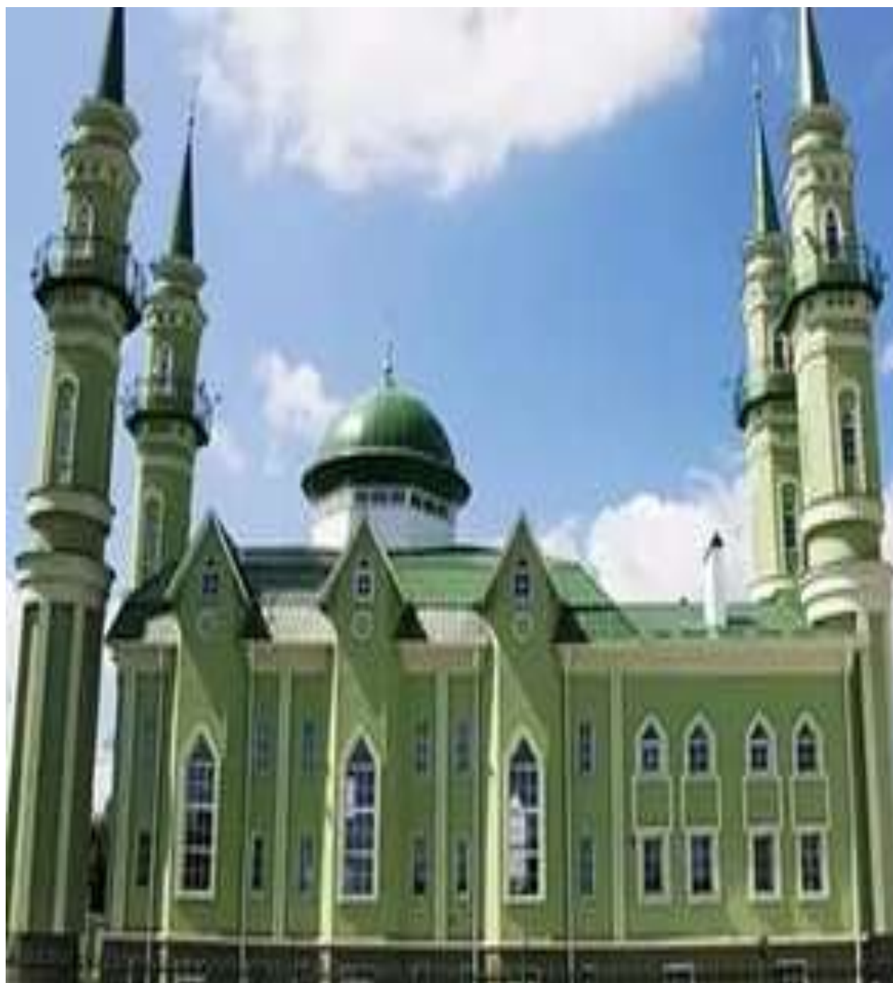
Мечеть г. Стерлитамак