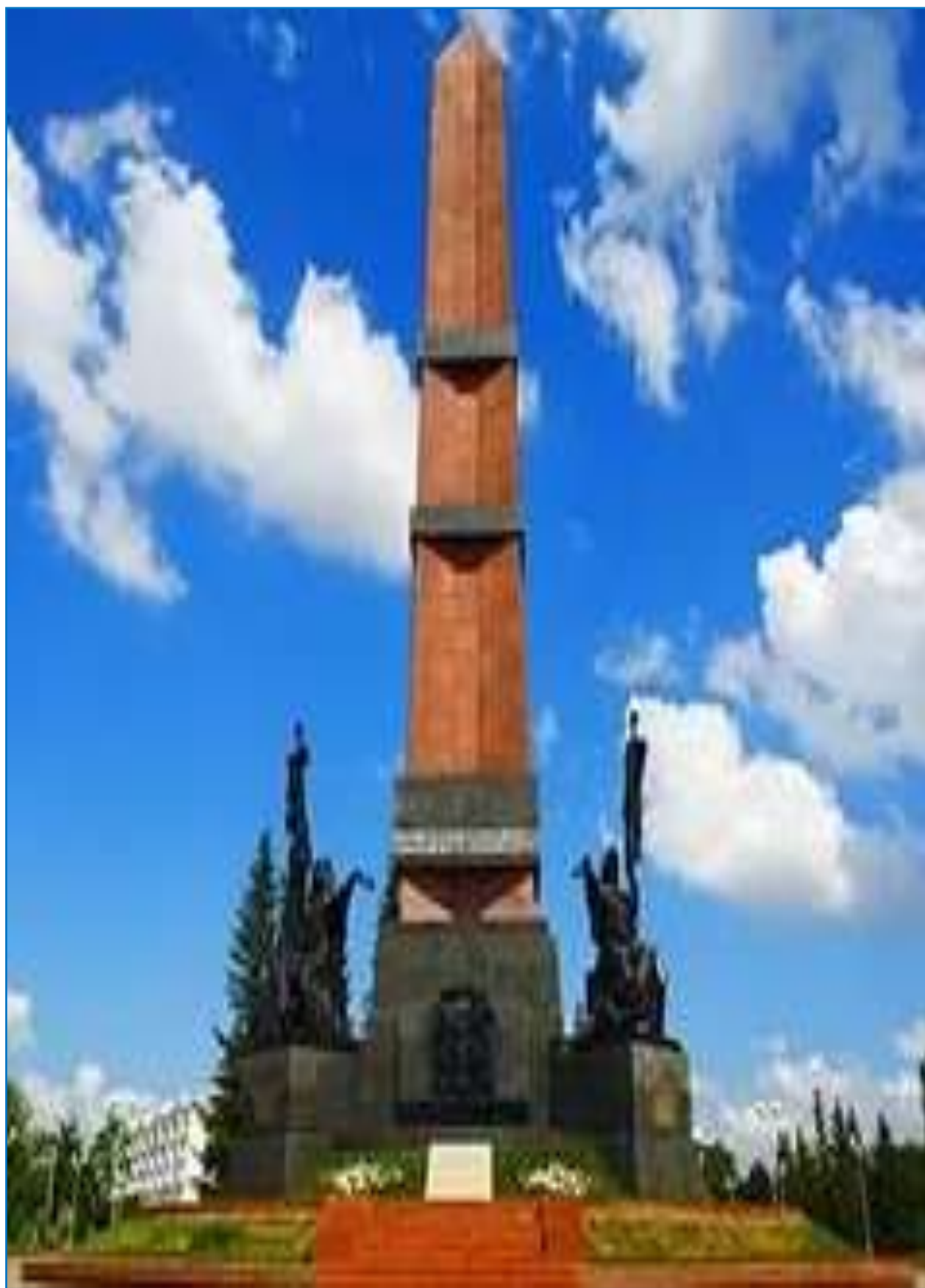
Монумент дружбы г. Уфа