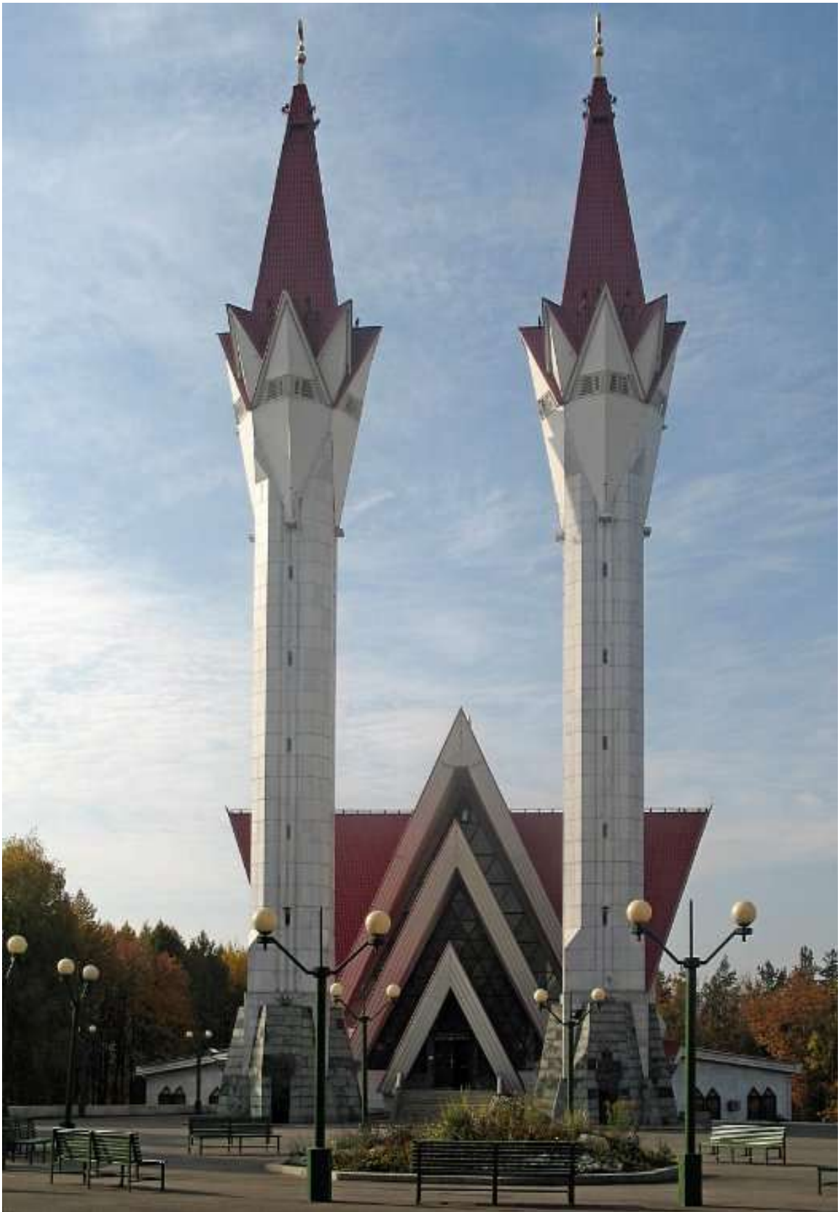
Мечеть Ляля –Тюльпан г. Уфа