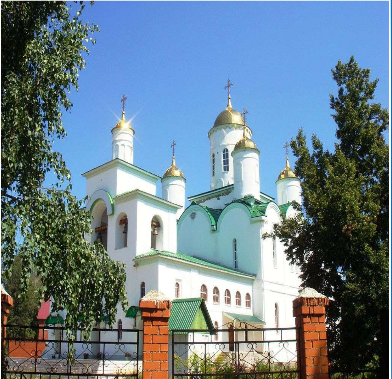
Православный Свято-Троицкий храм в городе Ишимбае