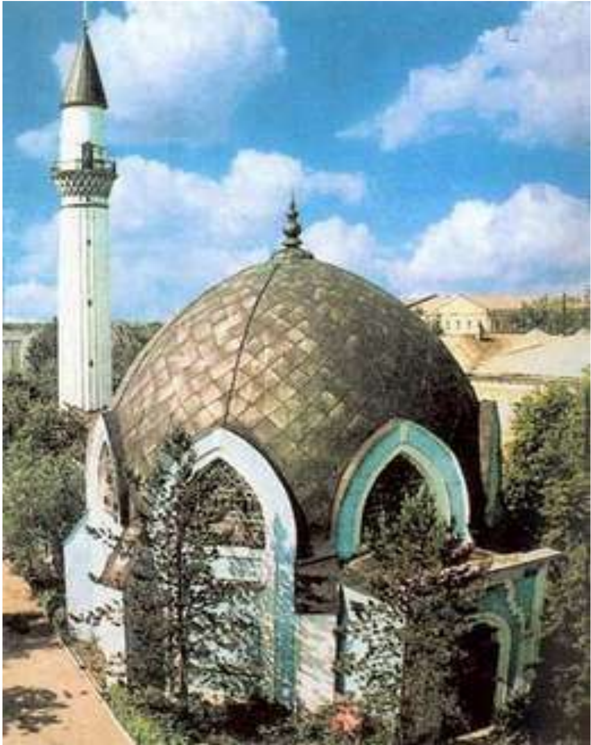
Караван- Сар ай уникальный памятник архитектуры г. Оренбург